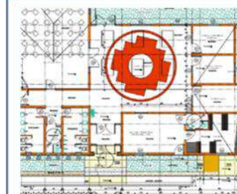
Reposición Sede Social Belén