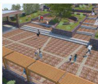
Mejoramiento Plaza Chapiquiña