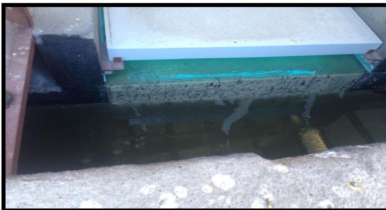
Cámara de UV de la Planta de Tratamiento de Aguas Servidas de Putre, tratamiento terciario de desinfección, se observa la grasa de color blanco depositada en el concreto.

Los aceites y grasas generados en la cocina son arrojados a la red de alcantarillado, como consecuencia de esta acción, los aceites y grasas de comienzan a depositar en la red de alcantarillado y en las cámaras de la Planta de Tratamiento de Aguas Servidas de Putre, generando una seria de problemas sanitarios, que son deposición de materia organiza que se pudre y genera olores molestos, estas deposiciones de material orgánico se depositan en todas las cámaras de la Planta de Tratamiento de Aguas Servidas afectando gravemente el funcionamiento de esta, ya que cada cámara de tratamiento se tapa, peor aun, afecta las bombas, los aspersores y a las lombrices que se encargan del tratamiento biológico, sumado a esto, las aguas no logran cumplir con los parámetros fisicoquímicos y bacteriológicos exigidos en la normativa ya que el parámetro DBO5 se ve alterado y su valor es muy alto.